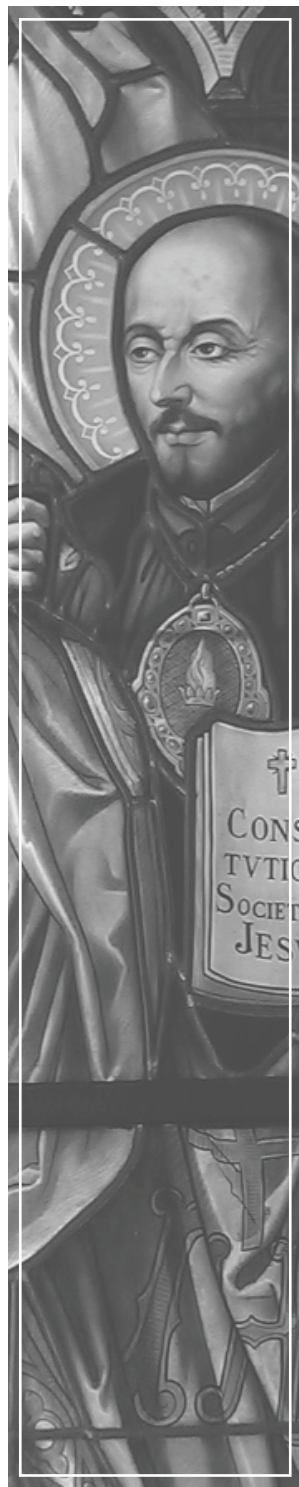
San Ignacio de Loyola