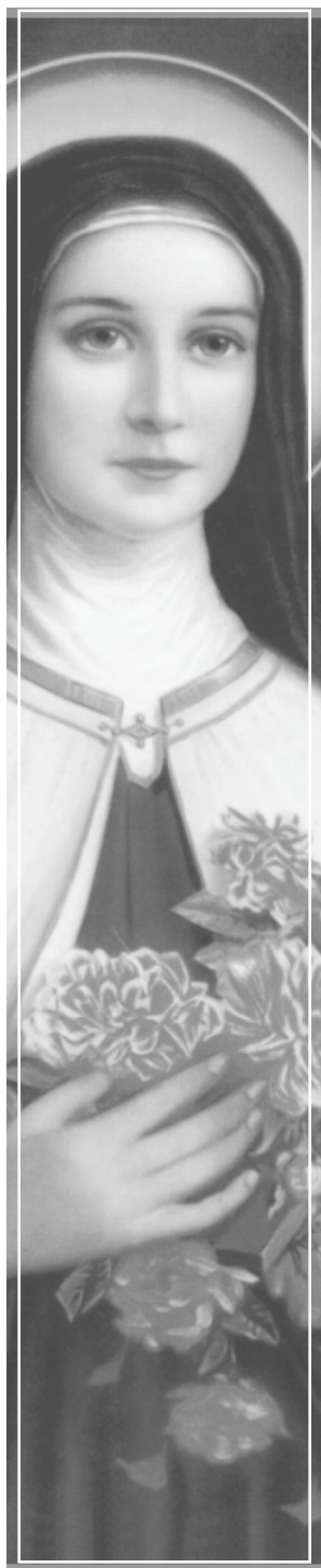
Santa Thérèse de Lisieux