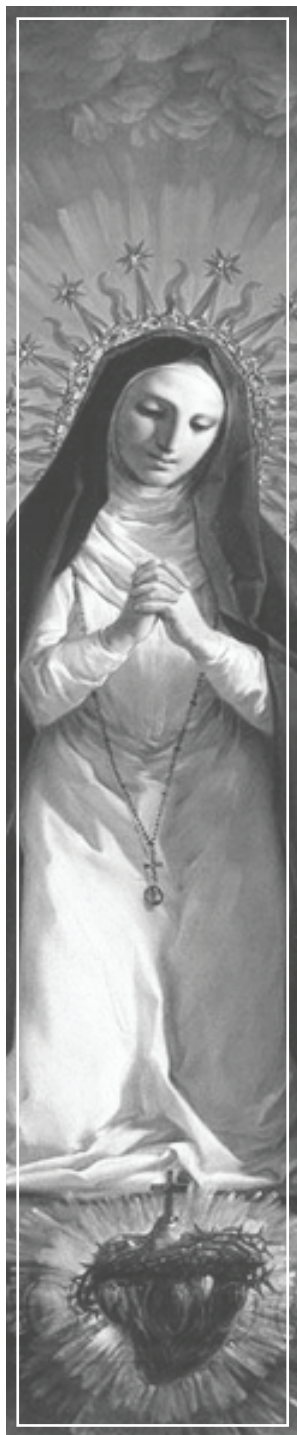
Santa Margarita María Alacoque