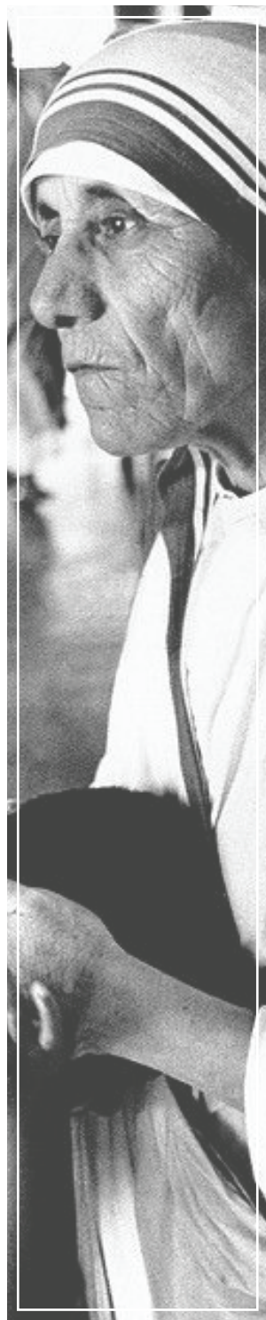
Santa Teresa de Calcutta